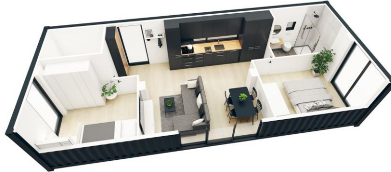
ZC – M60