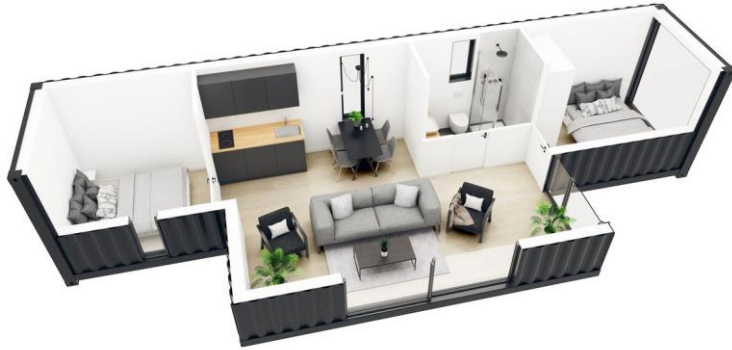
ZC – M45