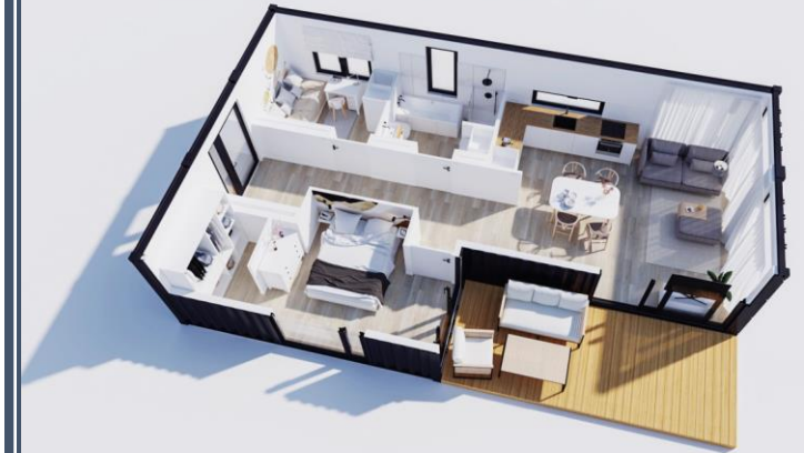
ZC – M75